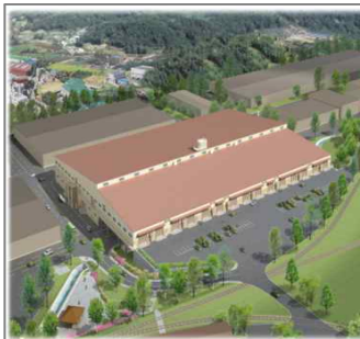
< 건축 조감도 >